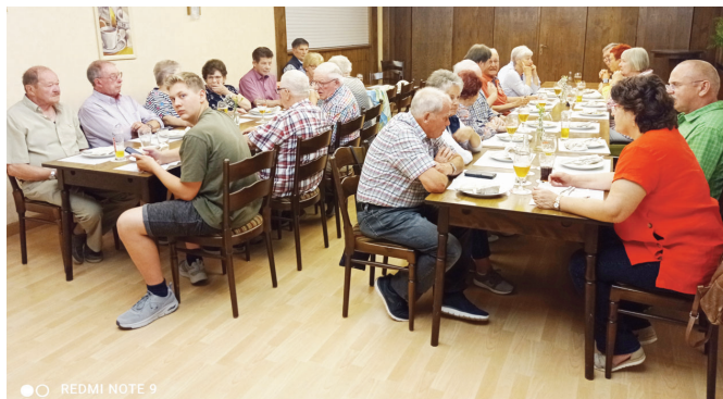
Die Sportschützenfamilie wartet auf das Mittagessen..

Am späten Vormittag traf man sich bei schönem Frühlingswetter in Liedtkes Biergarten und liess den gemeinsamen Tag mit einem Umtrunk und weiteren, vom Sportschützenkönig Hans Braun mitgebrachten Getränken ruhig angehen. Zur Mittagszeit wechselte man dann in die Gaststätte, um sich die Schnitzelgerichte schmecken zu lassen.