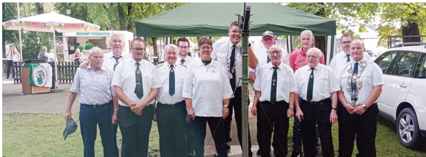
Die anwesenden Königinnen und Könige des Vereins machen sich zum Kaiserschiesen bereit :