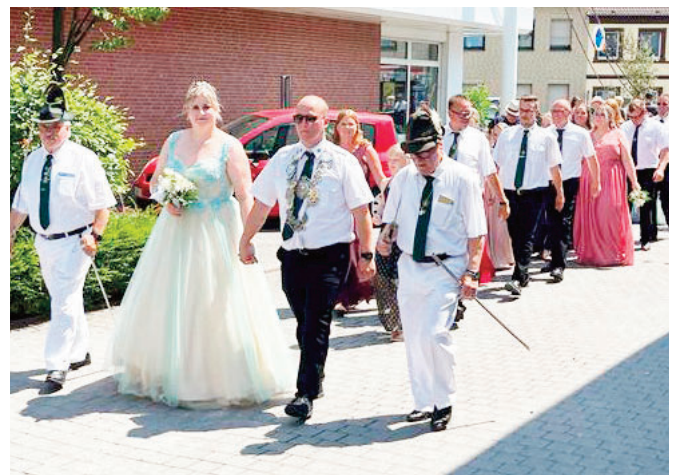
Königspaar und Hofstaat beim Einmarsch auf dem Westenschützenhof

Die Aufstellung erfolgte in Höhe der Christuskirche und nach dem Vorbeimarsch erfolgte direkt der kurze Marsch zum Altenheim St.Vinzenz Vorsterhausen,wo die Kapellen wieder mehrere Ständchen für die Bewohnerinnen und Bewohnern des Hauses gaben.Nach einem 30minütigem Aufenthalt gab der 1.Vorsitzende das Signal zum Abmarsch und der Verein machte sich auf den kurzen Weg zum Westenschützenhof.