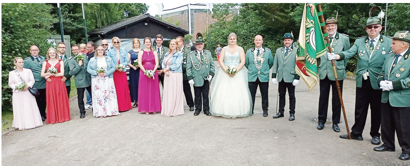
Beim Ausmarsch im Norden

Am letzten Ausmarsch des Jahres beim Schützenverein Nordenfeldmark1925 nahmen neben unserem aktiven Königspaar und Hofstaat leider wieder nur wenige Schützen teil.