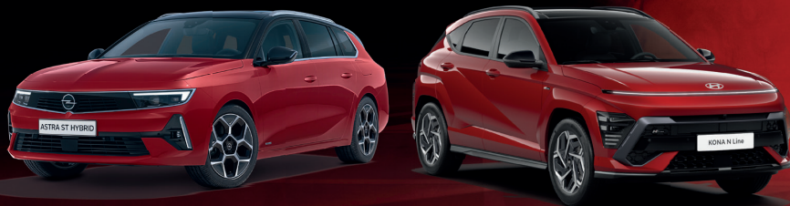
Abb. zeigt Sonderausstattung gegen Mehrpreis.

Unsere Standorte finden Sie auf: www.Ebbinghaus-Automobile.de