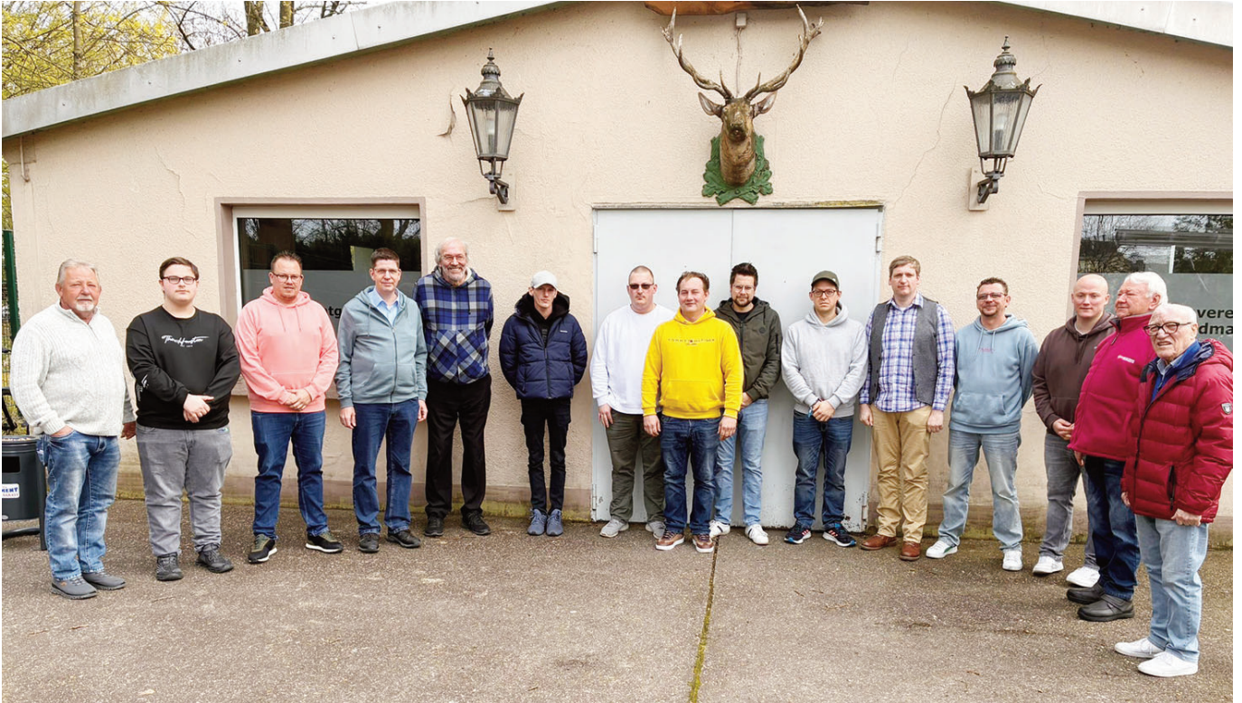
Unsere Avantgarde 2026

Unsere Avantgarde traf sich am 03. April zu ihrer traditionellen Generalversammlung am Karfreitag im Avantgardeheim.